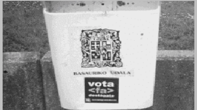
Pegatina electoral en Basauri (Vizcaya)

Los medios de comunicación como siempre hicieron caso omiso a nuestra labor, nuestros comunicados y propuestas fueron silencios, pero podemos considerar nuestra humilde campaña de gran éxito dado el número de personas que se han interesado por FA y han pedido material para su distribución.