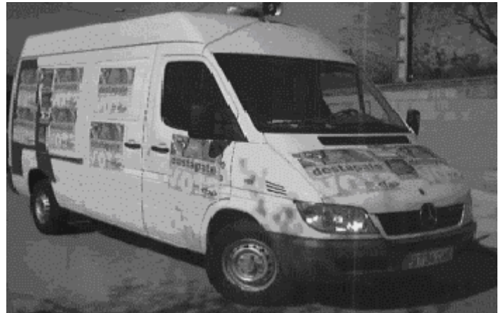
Furgoneta electoral de Falange Auténtica .

Ni que decir tiene que Falange Auténtica no ha defraudado ni a su electorado ni a aquellos que aun siguen a la expectativa y ha seguido adelante su correspondiente campaña electoral, caravana incluida.