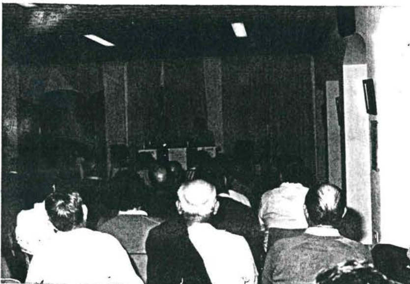
Aspecto que presentaba el salón de actos del Hogar del pensionista

FE-JONS para años posteriores, propone que la adjudicación de las casetas joven y municipal se haga mediante concurso público , "dando así oportunidad a los hosteleros del pueblo".